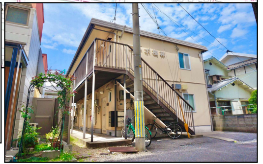
【概略図により現況を優先します】